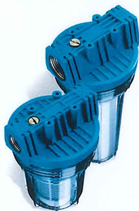
Contenitore per cartucce serie FP2 standard testa inserto ottone vaso SAN trasparente FP2 filter cartridge housings with brass inserts and transparent SAN sump