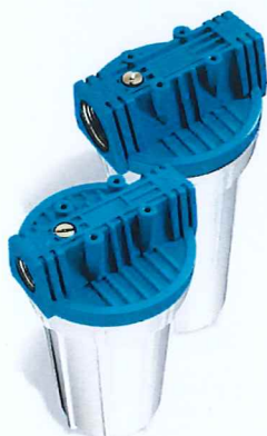
Contenitore per cartucce serie FP2 standard testa inserto ottone vaso opaco bianco FP2 filter cartridge housings with brass inserts and opaque white sump

* Alloggia cartucce speciali, foro 32mm / Special cartridges housing, hole 32mm.